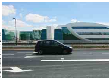
Près du campus dédié au cancer.

tram train fera escale du côté de la route de Seysses. Pierre Cohen, le président du Grand Toulouse, a même réactivé hier l'idée « doustienne » d'un téléphérique reliant « le campus de Rangueil au Cancéropôle en effaçant l'obstacle des coteaux de Pech-David ». ■